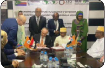
في تخطيط وتنفيذ المشروعات القومية بجزر القمر، ونقل الخبرات للأشقاء.