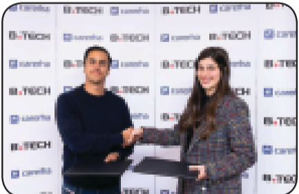
المشاركة الفعالة في مجالات العمل المختلفة، وخاصة التكنولوجيا وريادة الأعمال.