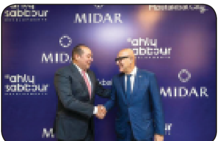
المطور العام لمدينة مستقبل سيتي، أن استراتيجيات الشركة تهدف إلى التعاون مع كبرى أكبر المستثمرين وشركات التطوير العالمية داخل مصر وخارجها ذات سابقة الأعمال والملاحة المالية التي تمكثها من تنفيذ مشروعاتها داخل المدينة حسب البرامج الزمنية.