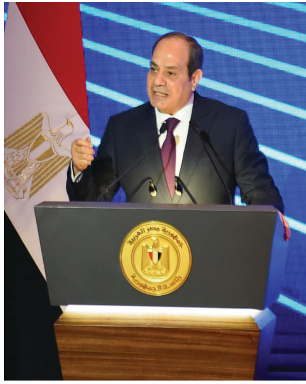
الرئيس عبد الفتاح السيسي يخطب أمام الحضور في احتفالية عيد الشرطة.